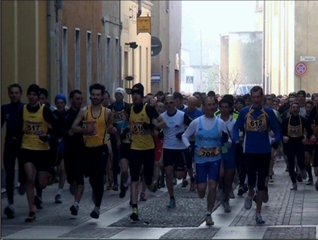
La partenza della 12 km